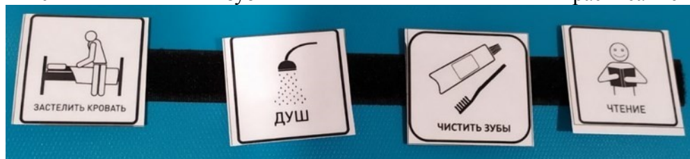
Рис.2 Расписание дня с карточкой «Чистить зубы»